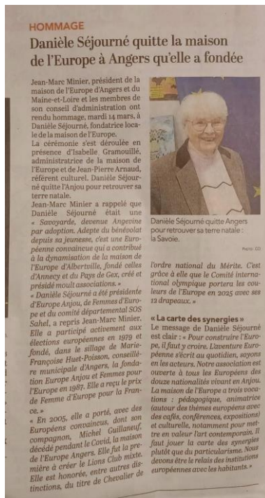
Le Courrier de l'Ouest 18/03/2023